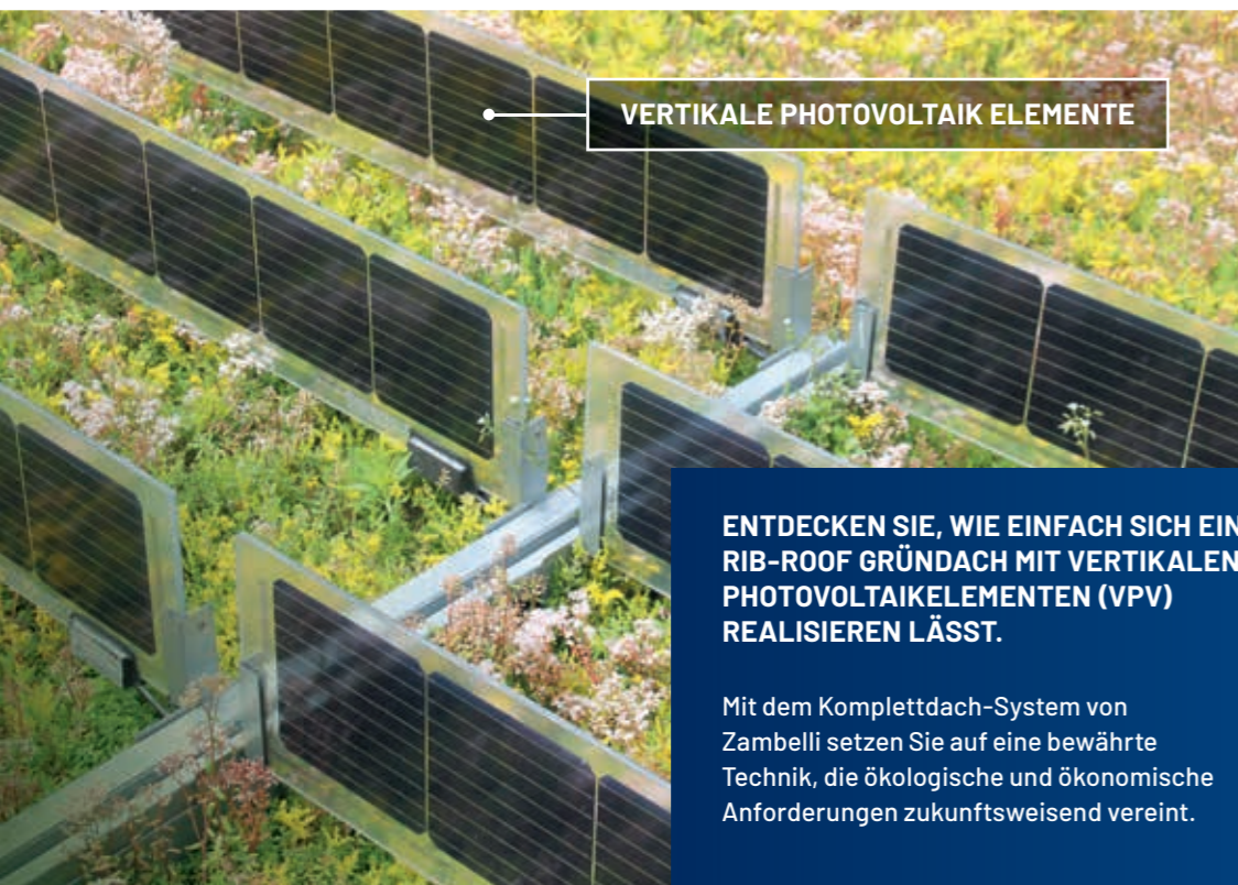
VERTIKALE PHOTOVOLTAIK ELEMENTE

ENTDECKEN SIE, WIE EINFACH SICH EIN RIB-ROOF GRÜNDACH MIT VERTIKALEN PHOTOVOLTAIKELEMENTEN (VPV) REALISIEREN LÄSST.