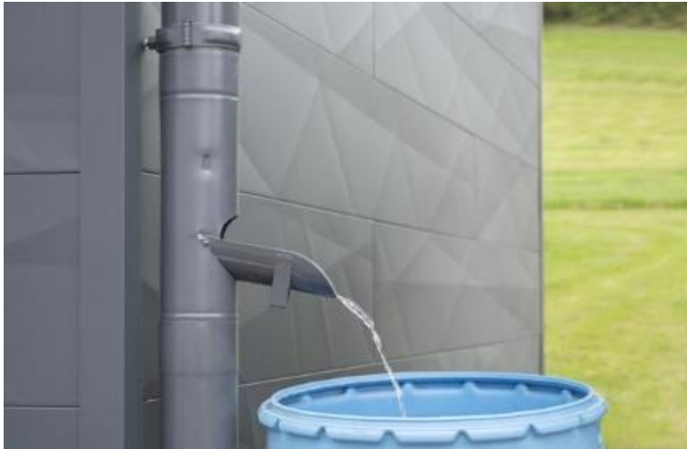
Die Regenwasserklappe wird auf Höhe der Regentonne im Fallrohr eingesetzt.