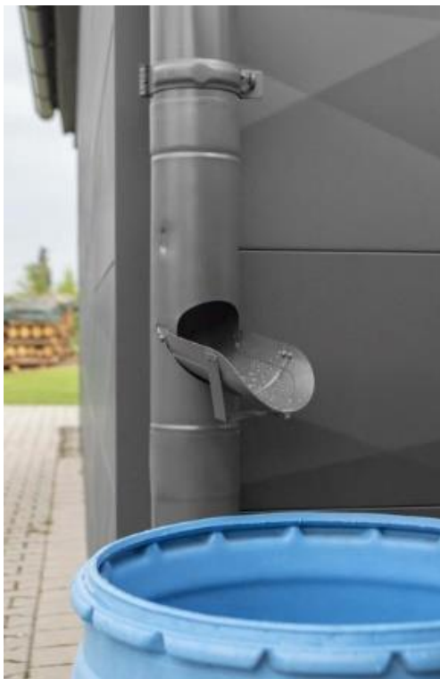
Um einem Zufrieren und der damit einhergehenden Gefahr eines platzenden Rohres entgegenzuwirken, entfernt man das Sieb im Winter.

Im Winter sollte das Sieb entfernt werden, um ein Zufrieren und platzenden Regenfallrohren vorzubeugen. Die Regenwasserklappe mit Sieb ist erhältlich für Durchmesser von 60 mm bis 120 mm und deckt somit einen Großteil der gängigen Größen ab.