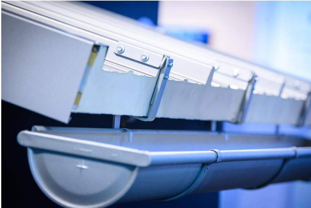
Ein absoluter Publikumsmagnet im Bereich der Dachentwässerung: Das innovative Rinnenhaken-Set für Sandwichpaneele von Zambelli.

Ein absoluter Publikumsmagnet im Bereich der Dachentwässerung war Zambellis neueste Entwicklung: das brandneue Rinnenhaken-Set für Sandwichpaneele. Der Rinnenhaken ist für alle gängigen Sandwichpaneele erhältlich und bietet eine handwerkerfreundliche Lösung. Zukünftig ist kein Vorbiegen der Haken oder Ausfräsen der Sandwichprofile mehr nötig, dies bedeutet eine enorme Zeitersparnis auf der Baustelle. Da es in diesem Bereich bisher keine technisch einwandfreie Lösung gibt, ist Zambelli mit dem neuartigen Rinnenhaken-Set Vorreiter am Markt. „Mit dem System gibt es endlich einen echten Problemlöser. Bisher musste der Halter kompliziert verborgt werden. Mit diesem Set, bestehend aus Obergurthalter und passend geformten Rinnenhaken, ist die Handhabung und Montage kinderleicht. Perfekt für effizientes Arbeiten auf der Baustelle“, sagt Spenglermeister und Messebesucher Stephan Martin.