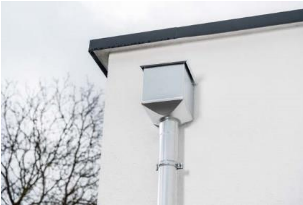
Moderne Optik und eleganter Anschluss zur Flachdachentwässerung: der neue Wasserfangkasten Design. Er überzeugt durch eine formschlankte Verbindung von Bodenblech und Mantel.

Neben der Vorstellung des beliebten Portfolios, zeigt Zambelli aber auch einige Innovationen. Mit dem Attika-Stutzen wird eine lückenlose Verbindung zwischen Fassade, Flachdach und Ablaufrohr geschaffen. Eine optisch ansprechende und systemkompatible Lösung. Zusätzlich stellt Zambelli den Wasserfangkasten Design , mit einer formschlanken Verbindung von Bodenblech und Mantel, vor. Mit dem neu entwickelten Kastentrinnenverbinder wurde eine wichtige Lücke im Bereich der Kastenrinnen geschlossen. Der Zambelli Regenwassersammler in schlanker Ausführung rundet die Sortimentsgruppe rund um das Thema nachhaltige Regenwassernutzung ab.