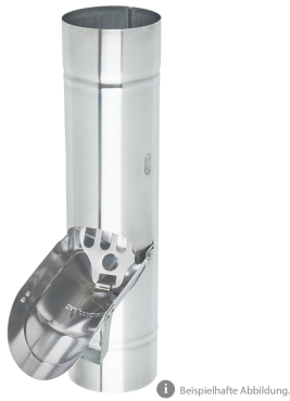
1 Beispielhafte Abbildung.

ARTIKELNUMMER: 117318-ZAM NENNGRÖSSE: 76 MATERIALART: Kupfer MATERIALNORM: PRODUKTABBILDUNG: