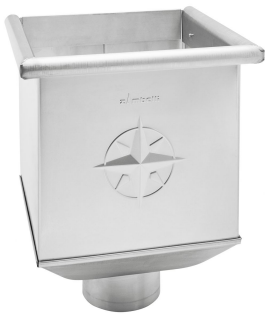
i Beispielhafte Abbildung.

ARTIKELNUMMER: 131915 NENNGRÖSSE: 87 MATERIALART: Titan-Zink MATERIALNORM: DIN EN 988 PRODUKTABBILDUNG: