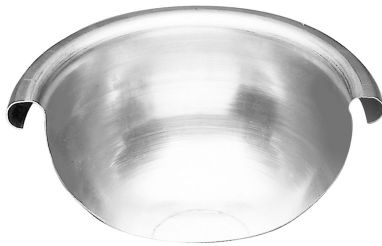
i Beispielhafte Abbildung.

ARTIKELNUMMER: 136300-ZAM NENNGRÖSSE: 400 MATERIALART: Titan-Zink PRODUKTABBILDUNG: