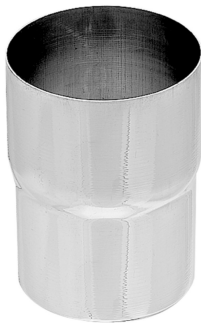
1 Beispielhafte Abbildung.

ARTIKELNUMMER: 137102 NENNGRÖSSE: 150 MATERIALART: Titan-Zink MATERIALNORM: PRODUKTABBILDUNG: