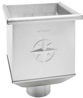
i Beispielhafte Abbildung.

ARTIKELNUMMER: 161910 NENNGRÖSSE: 100 MATERIALART: Edelstahl MATERIALNORM: DIN EN 10088 PRODUKTABBILDUNG: