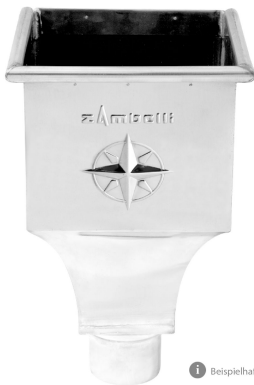
1 Beispielhafte Abbildung.

ARTIKELNUMMER: 171905 NENNGRÖSSE: 120 MATERIALART: UGINOX® Patina K41 MATERIALNORM: DIN EN 10088 PRODUKTABBILDUNG: