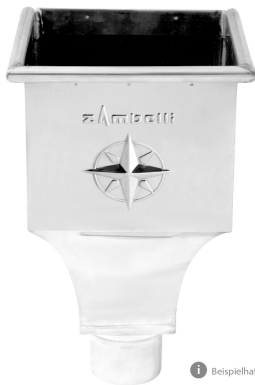
1 Beispielhafte Abbildung.

ARTIKELNUMMER: 171920 NENNGRÖSSE: 80 MATERIALART: UGINOX® Patina K41 MATERIALNORM: DIN EN 10088 PRODUKTABBILDUNG: