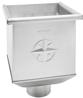
i Beispielhafte Abbildung.

ARTIKELNUMMER: 181910 NENNGRÖSSE: 100 MATERIALART: QUARTZ-ZINC® MATERIALNORM: DIN EN 988 PRODUKTABBILDUNG: